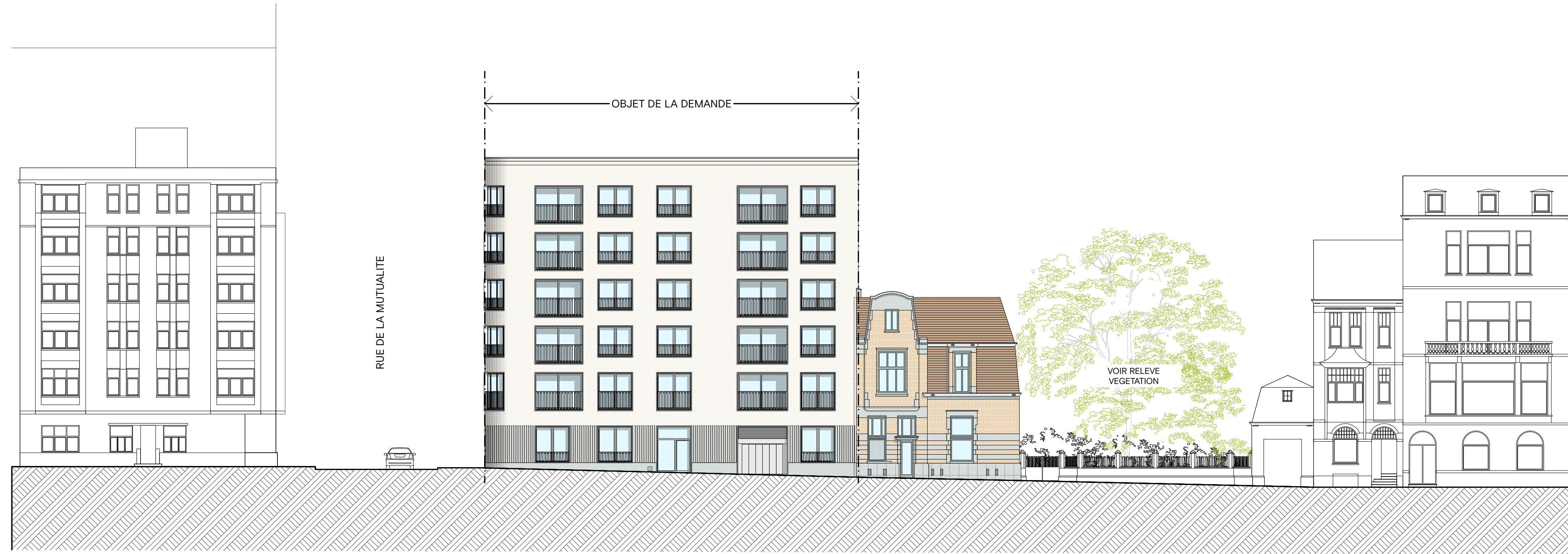
COUPE CONTEXTUELLE RUE MEYERBEER 1/200