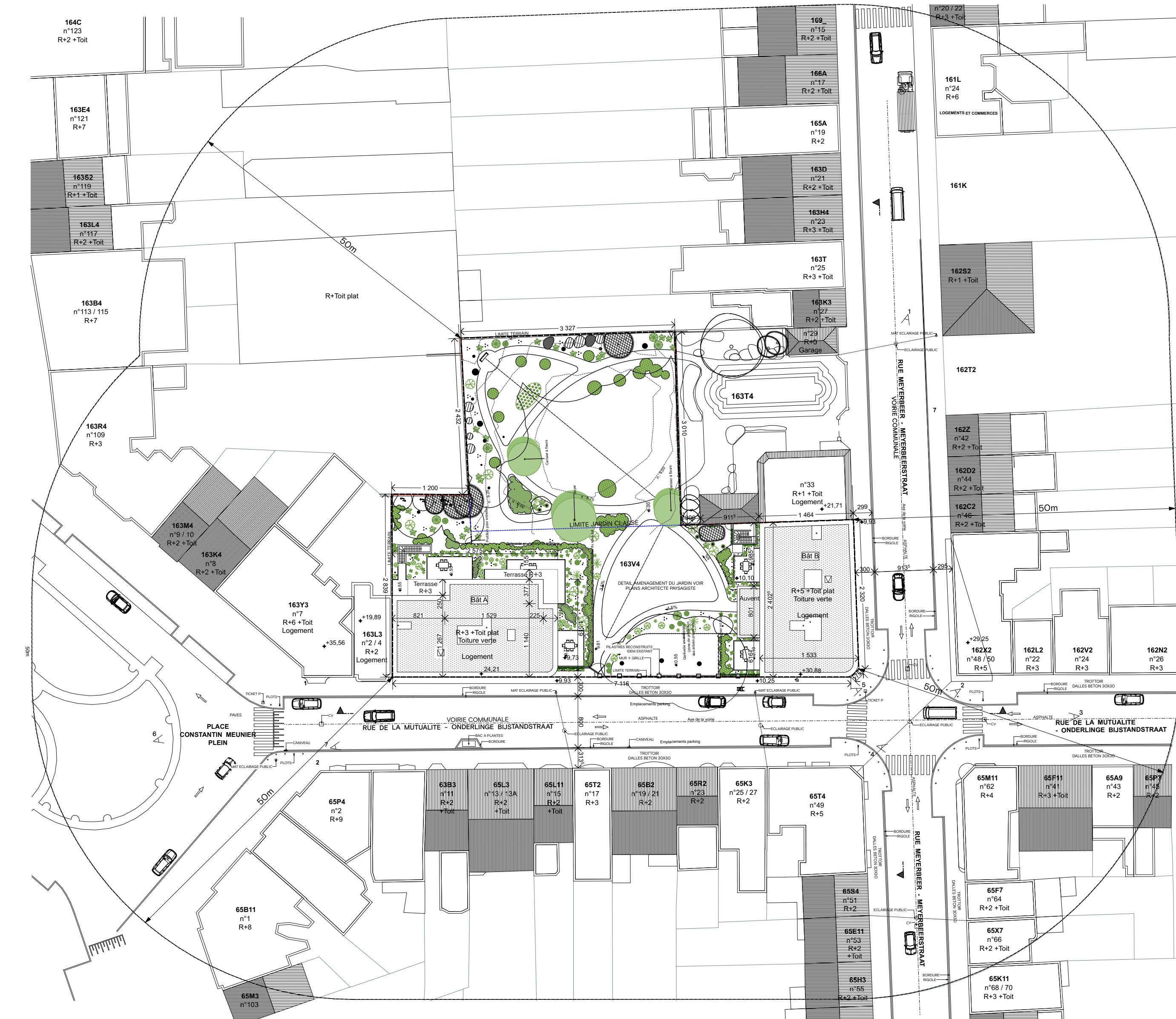
PLAN D'IMPLANTATION PROJETEE 1/500