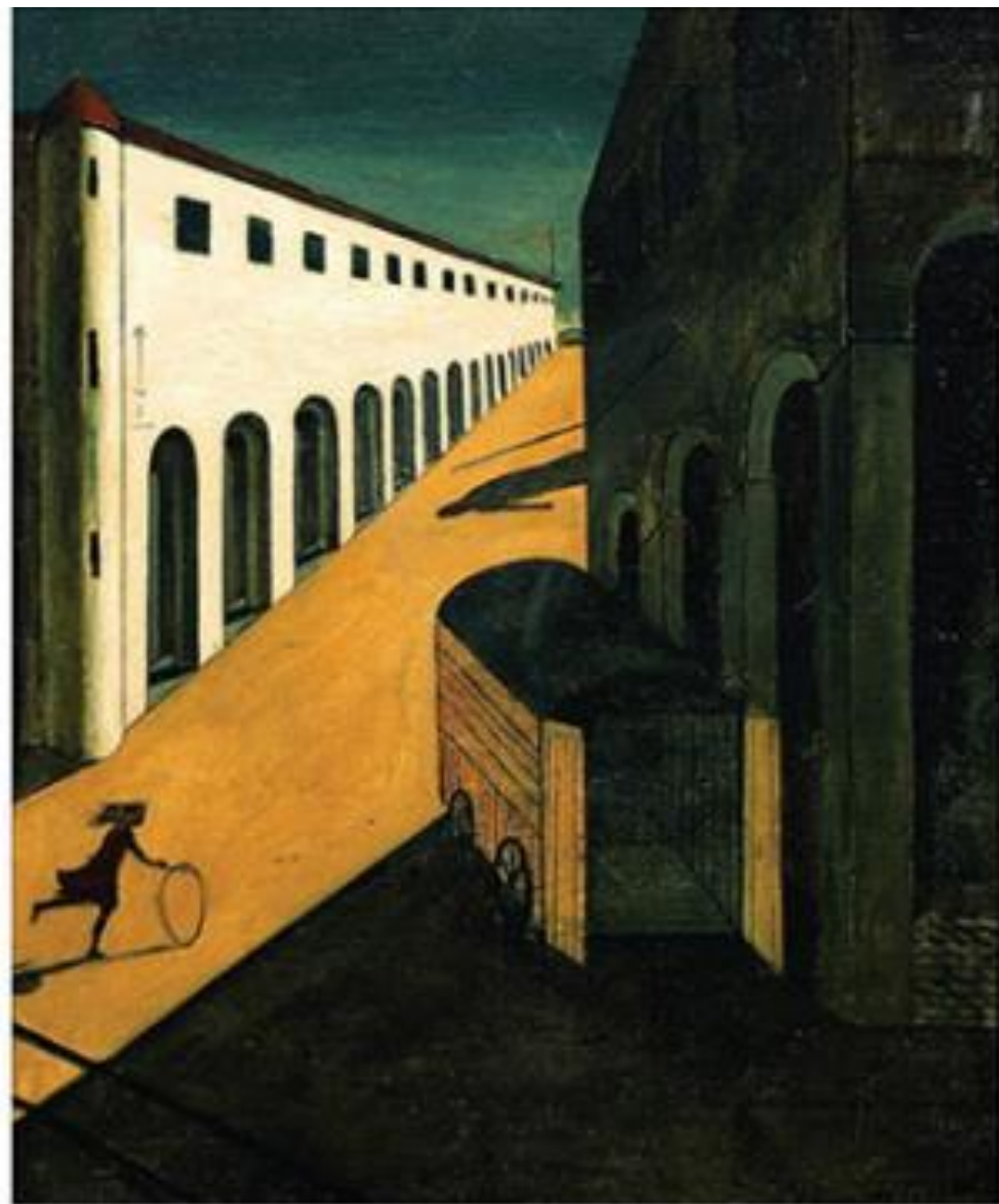
Ђорџо Де Кирико, Тајна и меланхолија улице