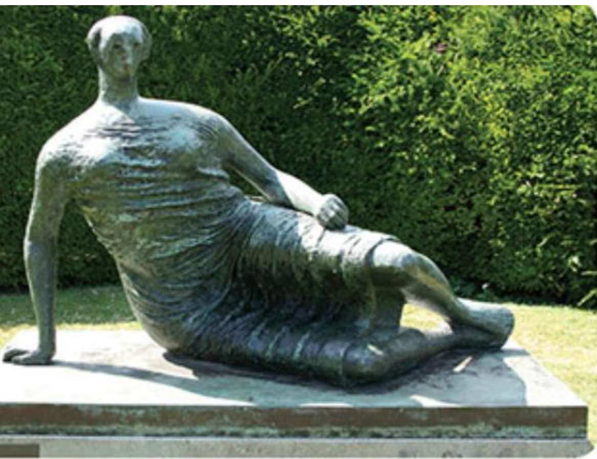
■ Хенри Мур, Завалјена фигура

Када је тело изложено светлости, сви његови делови не могу бити осветљени. Они делови тела који нису осветљени остају под сенком. Таква сенка се зове сопствена сенка .