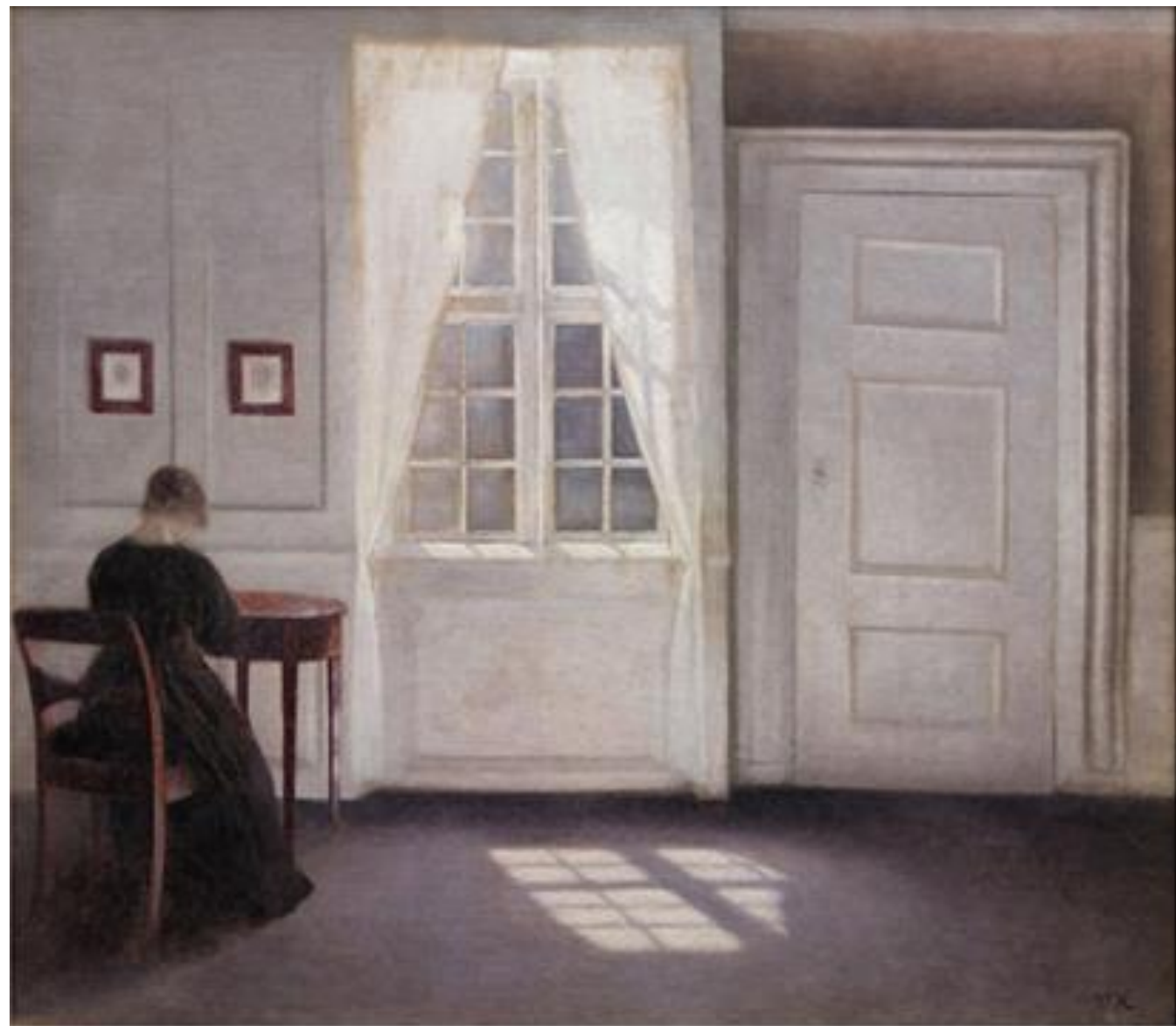
Вилијем Хамерсхој, Ентеријер са сунчевим зрацима на поду