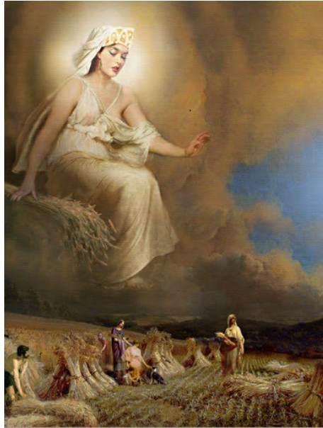
« Demeter, déesse des moissons » par Howard David Johnson

Dans la Nature, c'est la fin des moissons, il faut d'abord trier le bon du mauvais, puis faire des réserves pour l'hiver... Le Signe de la Vierge s'étend du 22 août au 22 septembre (Carte du Ciel de la Pleine-Lune du 2 septembre en annexe). C'est la fin de l'été, et surtout une période de transition avec l'automne où l'ambiance change toujours très nettement : fin des grandes chaleurs, lumière magique, envie de se poser calmement pour réfléchir, en Nature notamment où tout s'apaise... Ce que notre société ne permet pas vraiment puisqu'elle nous pousse dans l'effervescence de la « rentrée ». Et quelle rentrée cette année : muselés, épiés, contrôlés, considérés comme des esclaves serviles qui doivent respecter les règles !