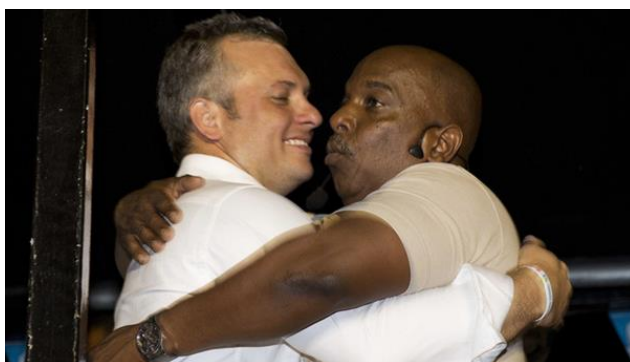
Gerrit Schotte (links) en Helmin Wiels op 20 oktober 2012 na de verkiezingen.

Dit keer was PS de grootste partij. Natuurlijk had ik gehoopt dat de verkiezingen de regeringspartijen, met name de PS, weg zou vagen, maar het was overduidelijk dat dat er niet in zat.