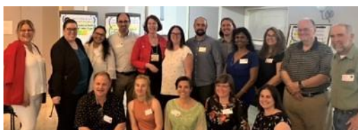
CGPKC - Collectif Greenfield Park Collective