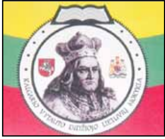
Kalgario Vytauto Didžiojo Lituanistinė mokykla