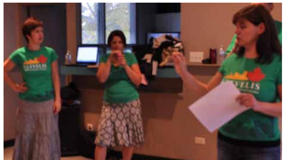
Šokių kolektyvas „Klevelis“