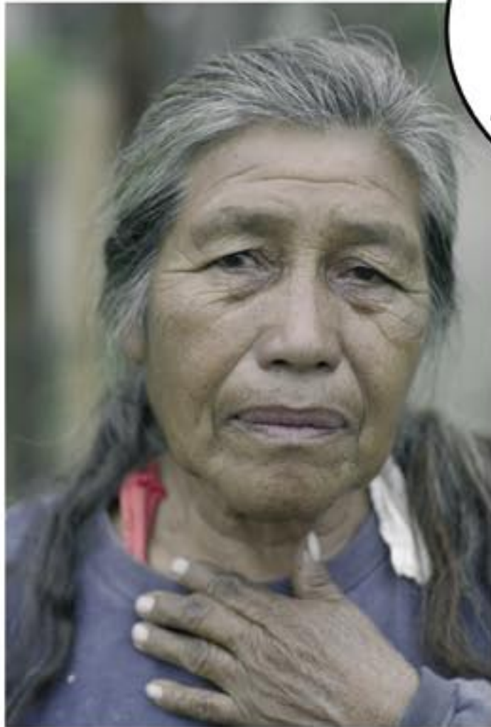
En gammal indiankvinna jag mött.

Christofer Columbus var upptäcktsresande och en av de första från Europa som kom till Amerika. När han kom fram trodde han att han var i Indien, så därför kallade han folket där för indianer! Idag kallas de oftast för "infödda" eller "ursprungsbefolkning"