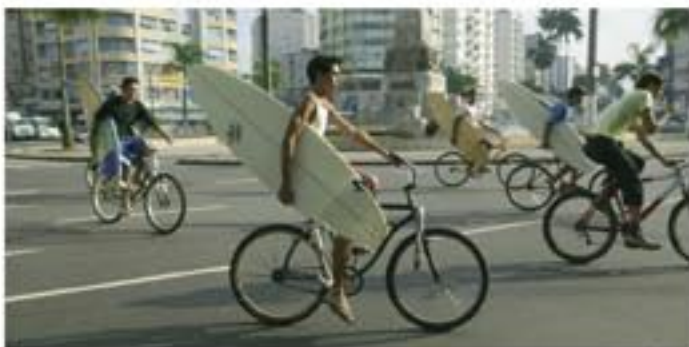
De här killarna mötte jag i Colombia. De var på väg till stranden för att surfa!