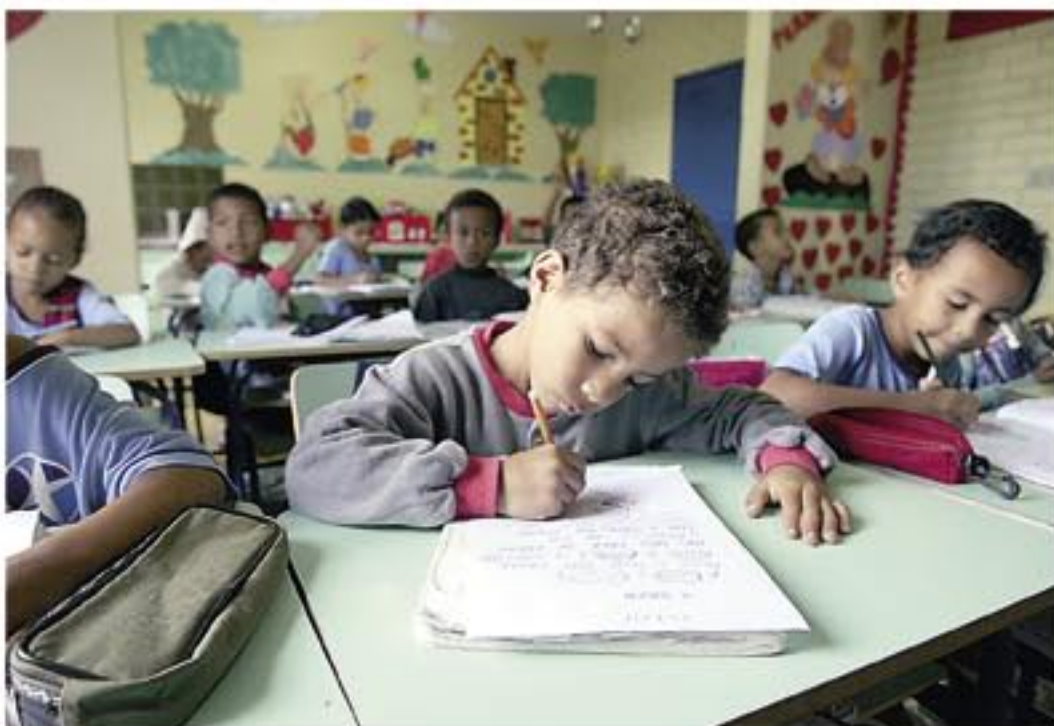
... och i skolan.