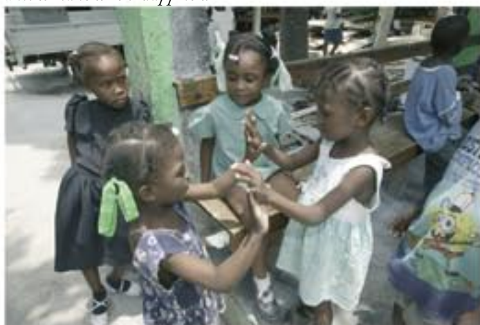
Bara två kvar nu ...