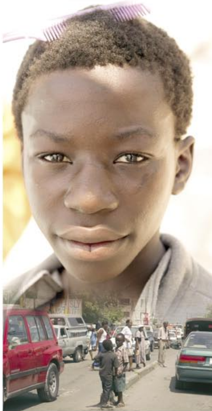
Gatubarn tvättar bilarnas fönster när de stannar för rött ljus.