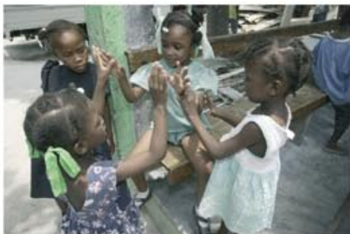
Flickorna leker en klapp-lek.