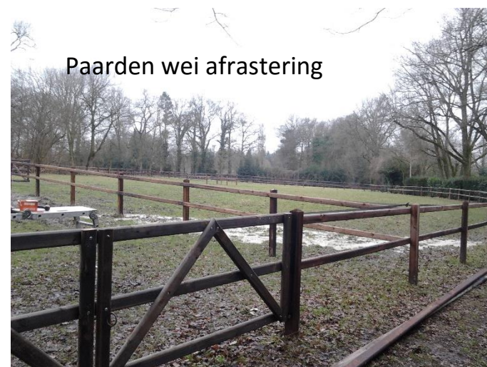
Paarden wei afrastering