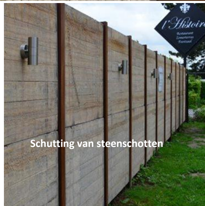
Schutting van steenschotten

http://www.slooiertuinen.nl/Regels-voor-erf-afscheidingsen.html