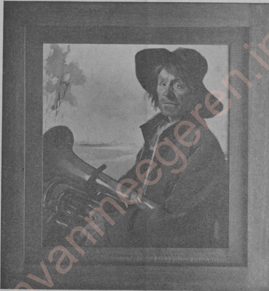
„Tinus”, Larensch type

En als portretkunstenaar bereikte v. Meegeren in de beeltenis van Mary L., een jong meisje aan de studie, ongetwijfeld het ideaal, dat hij zich als schilder gesteld heeft: hier heeft een geest de