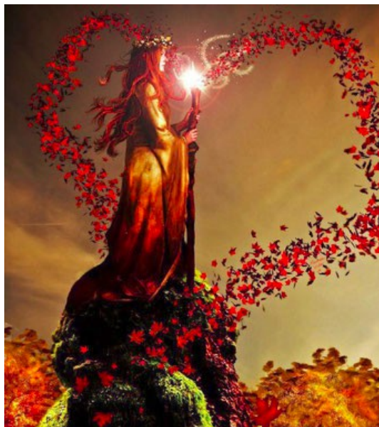
Force intérieure (auteur inconnu)