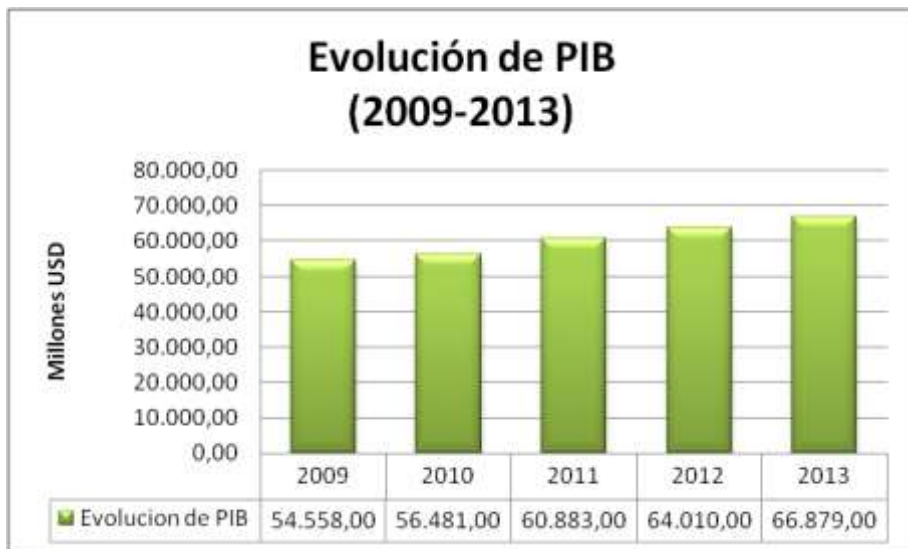
Figura2. Evolución del PIB (2009-2013)

Fuente: (Banco Central del Ecuador,, boletín anuario Nro.35, 2013)