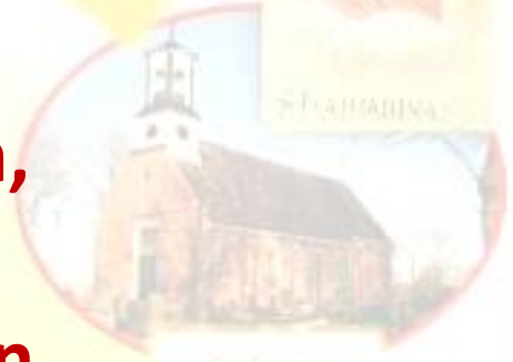
Aalsum 14.30 uur