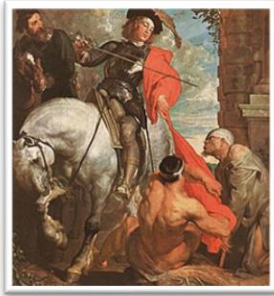
Heilige: Sint Martinus van Tours 'Deelde zijn mantel met een bedelaar'