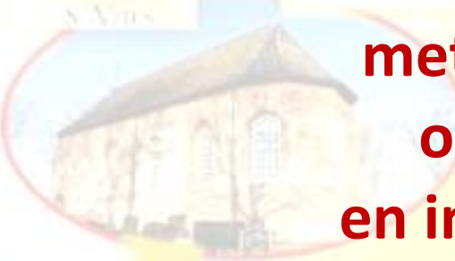
Wetsweel 14.00 uur