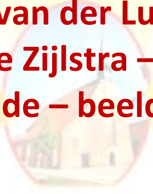
Doekum 15.30 uur