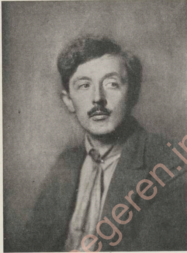
Portret van den schilder.

nieuwe verovering beteekent in de wereld van artistieke mogelijkheden, als de ontdekking van het stilleven het in de zeventiende eeuw en daarvoor was. Het heeft er allen schijn van, neen, het is zoo goed als zeker, dat de teekening zelf hare fundamentele beteekenis in dit ontwikkelingsproces nog eens met nadruk komt bevestigen. Er is niets dat zóózeer in staat is het wisselende in de verschijningen vast te leggen, dat zóó harmonisch correspondeert met het versnelde levenstempo van onzen tijd. En wie zich afvraagt waarom eigenlijk de Fransche kunst van 1830 in het Museum Mesdag een zoo veel pakkender indruk maakt dan al wat Louvre en Luxembourg op dit gebied in voor 't algemeen aan complete stalen en voorzeker overvloediger laten zien, vindt de gereede verklaring daarvan in het meer schetsmatige, spontane karakter van de schatten van dit in dit opzicht unieke en zoo zeldzaam representatieve Hollandsche Museum, waar men het meest uitgesproken teekengenie der Haagsche school, Bosboom, als schilder in volle kracht eerst recht geniet in de magistrale olie-verfschetsen welke daar van hem hangen. Deze