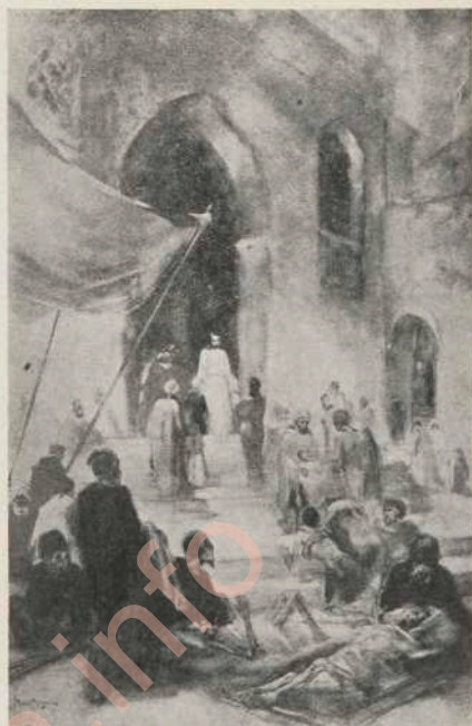
Christus geneest de kranken.

Eigendom van den Kunsthandel L. Beck, Den Haag.