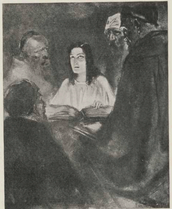
Christus als Jongeling.