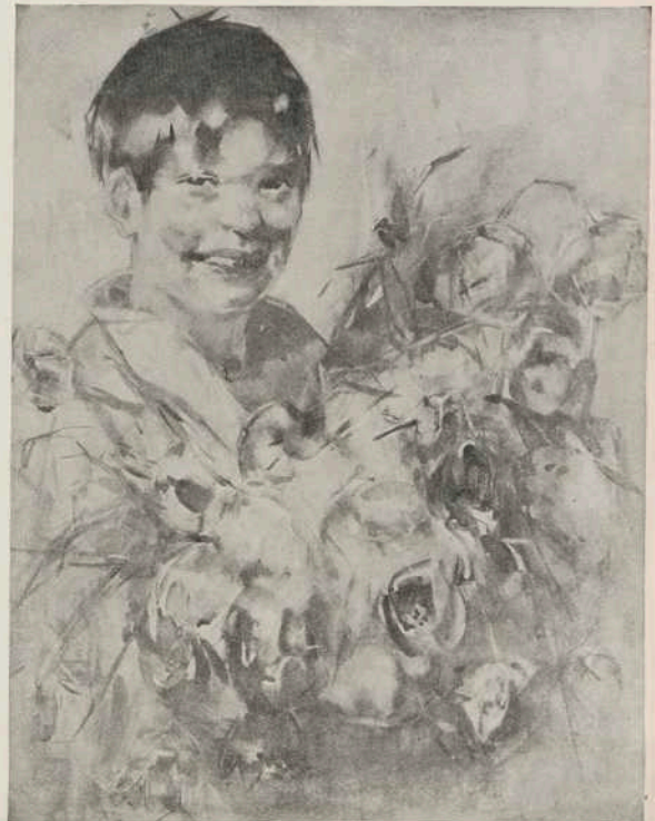
Jongen met tulpen.