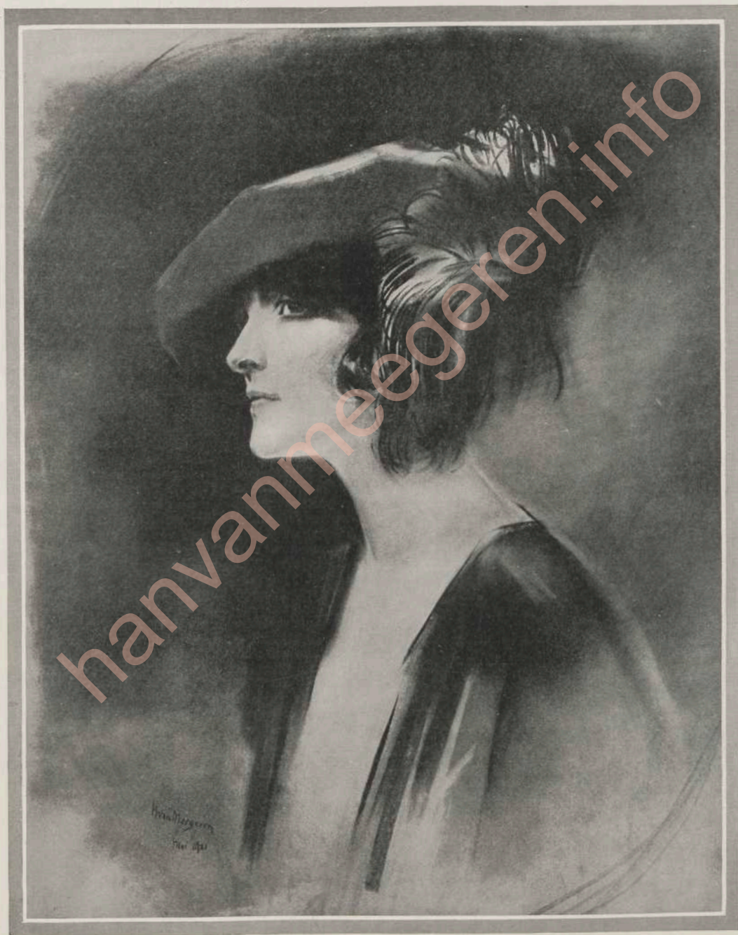
H. van Meegeren.