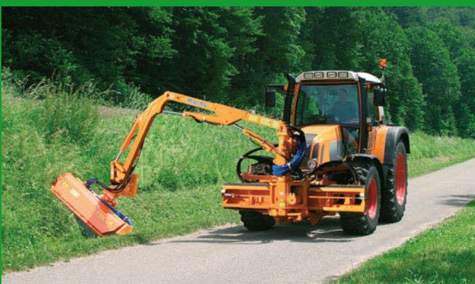
Meget stor rækkevidde på 6 m (teleskop arm 7 m (option))