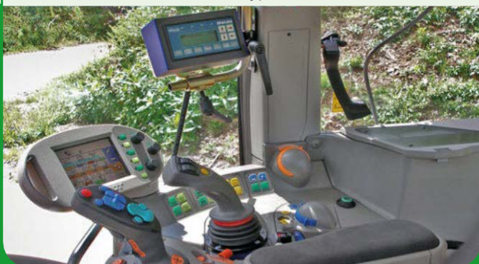
En hånds betjent multifunktions joystick