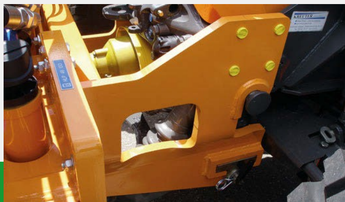
Hurtigskift system - anvendeligt i alle situationer