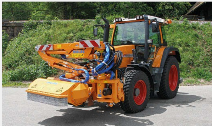
MFK 500 i transportstilling