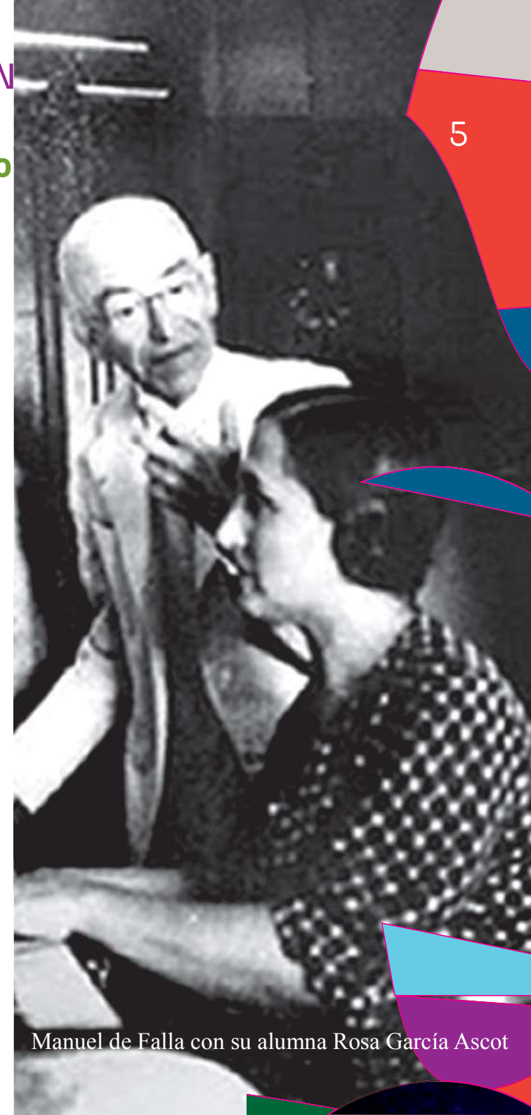
Manuel de Falla con su alumna Rosa García Ascot