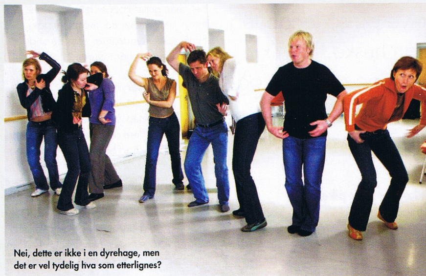
Nei, dette er ikke i en dyrehage, men det er vel tydelig hva som etterlignes?