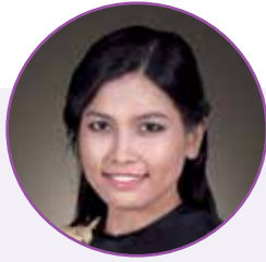
ဆင့်စန္ဒာ (Stamford MBA)

သင်ယူတယ်ဆိုတာ ခဏတာနဲ့ ပြီးဆုံးသွားပြီဆိုတာ မရှိပါဘူး။ ဘဝမှာ အောင်မြင်ဖို့ဆိုရင် ဗဟုသုတတွေ၊ ပညာတွေပြည့်ဝဖို့လိုအပ်တဲ့အတွက်လည်း အမြဲတမ်း သင်ယူ ဆည်းပူးလေ့လာနေ မှပဲပြည့်စုံနေမှာပါ။ ဘွဲ့တစ်ခု၊ အပ်ပလိုမာ တစ်ခု ရရှိလောက် နဲ့မဟုတ်ဘဲ ကြိုး စားပြီး ဖတ်မှတ် လေ့လာမှုတွေ လုပ်စေ ချင်ပါတယ်။ ဖတ်ပြီး သားစာတွေကို လည်း တကယ် လက်တွေ့ဘဝမှာ ပြန် အသုံးပြုနိုင်အောင် ခွန်အားစိုက်ထုတ် စေချင်ပါတယ်။ ဆရာမတော့ ကျောင်း သားတွေကို မှာချင်တာ ပညာနဲ့ပတ် သက်ပြီး လောဘကြီးစေချင်တယ်။ ရုပ်ဝတ္ထုပစ္စည်းတွေ ပေါ်မှာတော့ တတ် နိုင်သလောက် တင်းတိမ်ရောင့်ရဲပြီး နှစ်သစ်မှာ ခွန်အားနဲ့ ကြိုးစားပြီး တိုး တက်လာမယ့် အခွင့်အလမ်းတွေကို ရယူကြပါလို့ တိုက်တွန်းလိုပါတယ်။