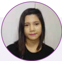
ထက်ထက်လွင် (English Elementary)

၂၀၁၇ မှာတော့ ကျွန်တော် မှန်း ထားတာ အလုပ် (၄) ခု ရှိပါတယ်။ ပထမ တစ်ခုက အခုကျောင်းကဖွင့်တဲ့ ဒီအတန်း ကိုတက်ဖို့ပေါ့။ ဒုတိယတစ်ခုက ကျွန်တော် တက်နေတဲ့ NMDC မှာလည်း ခရီးသွားနဲ့ ပတ်သက်ပြီး သင်နေတာလည်းရှိတော့ အဲဒါနဲ့ဆက်စပ်ပြီး အပြင်အလုပ်တစ်ခုမှာ အတွေ့အကြုံ ယူဖို့ရှိပါတယ်။ တတိယ တစ်ခုက ကိုယ်ကာယကြံ့ခိုင်မှုအတွက် Gym ဆော့မယ်။ နောက်ဆုံးတစ်ခုက သင်တန်းတွေပြီးရင် နှစ်ကုန်လောက်မှာ ခရီးသွားအပိုင်းမှာပဲ အလုပ်ဝင်ဖို့ရှိပါတယ်။ ဘာသာစကားကတော့ အင်္ဂလိပ်စာတော့ အဆင်ပြေနေပြီး အခြားသင်တန်းလေး တက်ဖို့လည်း မှန်းထားတယ်။ ဒီမှာတော့ BMA နဲ့ Marketing သင်တန်းတွေကို ထပ်တက်ဖို့လည်း မှန်းထားပါသေးတယ်။