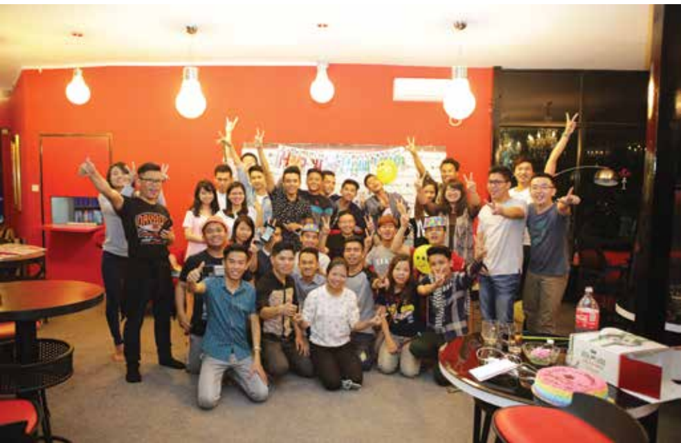
STRATEGY FIRST INSTITUTE မှ ဆရာများနဲ့ဝန်ထမ်းများမှ Planning Vacation ခရီးစဉ်အဖြစ် ငွေဆောင်ကိုည (၂) နာရီမှာ ပျော်ရွှင်စွာထွက်ခွာခဲ့ကြပြီး နှစ်သစ်ကူးညချမ်းလေးကို ကုန်လွန်စေခဲ့ပါတယ်။

ဟေမန်လရဲ့အေးမြတဲ့ညချမ်းလေးဖြစ် ပေမယ့်လည်း အရသာရှိလှတဲ့ Hot Pot ပူးပူးနွေးနွေးစားသောက်ဖွယ်တွေကိုလည်း ပျော်ရွှင်စွာစားသုံးရင်းနှစ်ဟောင်းရဲ့ အမောတွေကို ဖြေလျော့ခွင့်ရခဲ့တဲ့ အမှတ်ရစရာ နှစ်သစ်ကူးညချမ်းလေးလည်း ဖြစ်ခဲ့ပါတယ်။