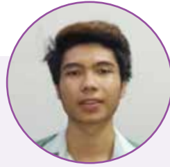
သုတဇော် (Management of Travel & Tourism Operations)

နှစ်သစ်အတွက်တော့ ခရီးသွားဖို့ ရှိသလို အခုတက်နေတဲ့ သင်တန်းပြီးရင် ကိုယ်ပိုင်လုပ်ငန်းလေးတစ်ခု စဖို့တော့ ရှိပါတယ်။ ကျွန်တော်က အလှူကုန်ပစ္စည်း ဈေးကွက်မှာ ကျင်လည်နေတဲ့သူဆိုတော့ ကိုယ်ပိုင် Saloon ဆိုင်လေး ဖွင့်မယ် Product Distribution အတွက်လည်း ကိုယ်ပိုင် Brand တစ်ခုနဲ့ လုပ်ဖို့လည်း ရှိပါတယ်။ အခုမှာတော့ ကိုယ်ဖွင့်မယ့် ဆိုင်အတွက် နေရာရွေးတာပြီးလို့ ဆိုင် စာချုပ်တွေချုပ်ဆိုနေပါပြီ။ အတွင်းပိုင်း ပြင်ဆင်မှုလည်း လုပ်နေတာပါ။ ဒီရေပိုင်း မှာလည်း ကိုရီးယား ကုမ္ပဏီတစ်ခုမှာ လည်း Sale and Marketing အပိုင်းမှာ အတွေ့အကြုံ ယူခဲ့တာလည်းရှိတော့ လာမယ့်နှစ်မှာ ကိုယ်ပိုင်လုပ်ငန်းပဲ လုပ် ကိုင်တော့မှာပါ။