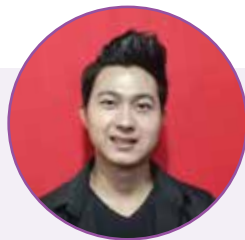
ဖွဲ့သစ် (Logistics and Supply Chain Management)

လာမယ့် (၄) ရက်နေ့မှာ ဆရာ တို့နဲ့အတူ ဘန်ကောက်သွားဖို့လည်း ရှိတယ်။ နှစ်သစ်ကူးအခါမှာတော့ သူငယ် ချင်းတွေနဲ့အတူ အိမ်မှာ Hot Pot လုပ်စားကြမယ်။ အတူတူ ပျော်ပျော် ရွှင်ရွှင်နေကြမယ်။ လျှောက်လည်ဖို့လည်း မှန်းထားပါတယ်။ လာမယ့်နှစ်မှာတော့ ကိုယ့်ရဲ့အင်္ဂလိပ် အရည်အသွေးတွေ Communication Skills တွေကောင်း လာဖို့ ကြိုးစားဖို့ ရှိပါတယ်။ အင်္ဂလိပ်စာ အတန်းတွေလည်း တက်ဖို့ရှိပါတယ်။ မတ်လစာမေးပွဲ ဖြေဖို့အတွက်လည်း ပြင်ဆင်ဖို့တွေလည်းရှိတော့ Learning လုပ်တာတွေ စာကျက်တာတွေကတော့ အများကြီးလုပ်ရဦးမှာပါ။ မနက်ကလိုအပ် ချက်တွေကို လာမယ့်နှစ်မှာ အကောင်း ဆုံး ပြင်ဆင်သွားရင်းနဲ့ ကြိုးစားသွား ရပါမယ်။