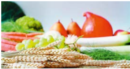
Mit ballaststoffreicher Ernährung schützen Sie den Darm und stärken die Abwehr.

Noch in den 80er Jahren glaubte man, der Darm sei steril, also frei von Keimen und Bakterien. Heute weiß man, dass er, der ausgebreitet so groß wie zwei Tennisplätze wäre, ein „Biotopt“ von rund zehn Billionen Bakterien darstellt. Kommen diese aus dem Lot, so vermuten Wissenschaftler, können Krankheiten entstehen, zum Beispiel Neurodermitis. Rund 500 verschiede-