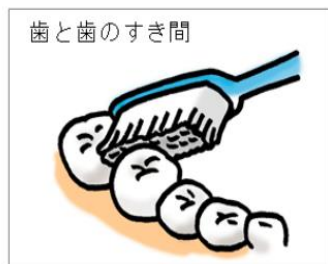
歯ブラシの先で念入りに