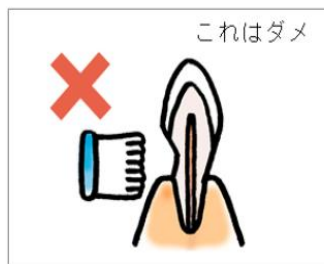
大きくゴシゴシと横に動かしても、歯が傷つくだけで汚れはとれない