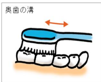
毛先をしっかり当ててみがく