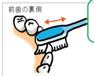
歯ブラシの先で1本ずつ小刻みに縦に20回動かす