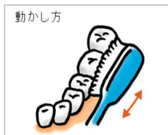
2～3mmの幅で、歯ブラシを軽く小刻みに20回動かす