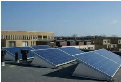
Platte daken toepassing

Meerprijs voor montage op platte daken i.v.m. aluminium steunen en benodigde bevestigingsmateriaal ( troitoir bandjes ) voor montage van de steunen.