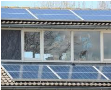
Schuine daken toepassing

dus inclusief extra groep in meterkast, aardlekschakelaar , installatie, steunen verbindingskabels kabel naar meterkast ( montage over muur maximal 25 meter ) e.d.