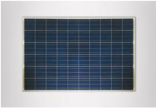
BYD paneel 240 Wp