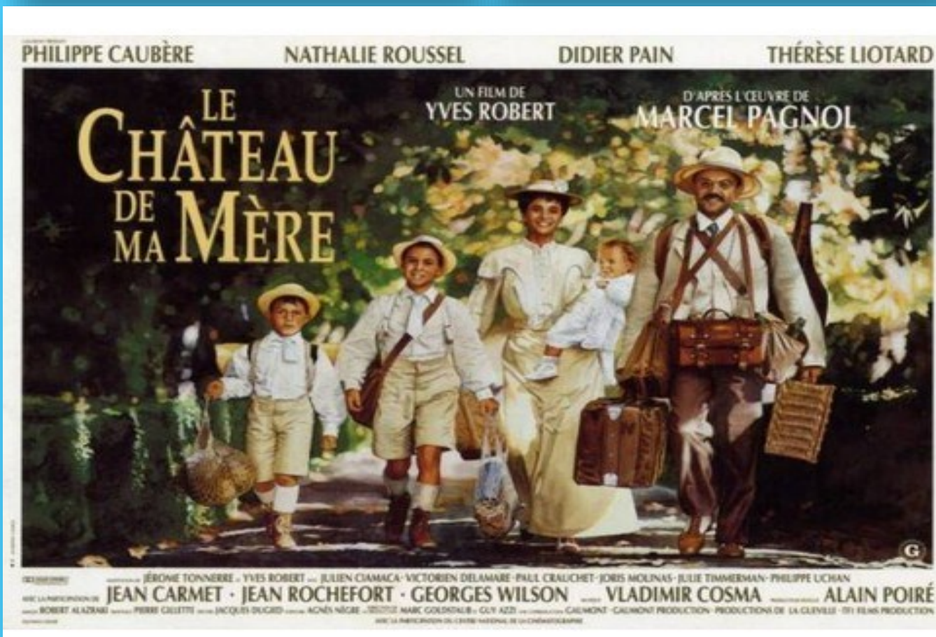
Les Souvenirs d'enfance de Marcel Pagnol au cinéma : Yves Robert (1920-2002) a réalisé les deux premiers volets en 1990 : La Gloire de Mon Père et Le Château de Ma Mère , Christophe Barratier (né en 1963) le dernier en 2022 : Le Temps des secrets .