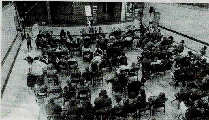
Une salle aussi pleine que possible.

la Nouvelle République Monnaie 37 le 29 mai 2021