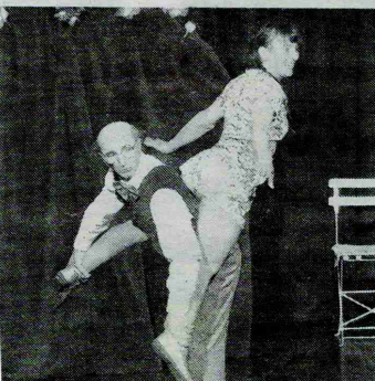
Un duo au top de la complicité.

Si les enfants étaient naturellement les plus nombreux, les parents qui remplissaient le reste des sièges disponibles, dans le respect de la jauge prescrite, n'ont pas non plus