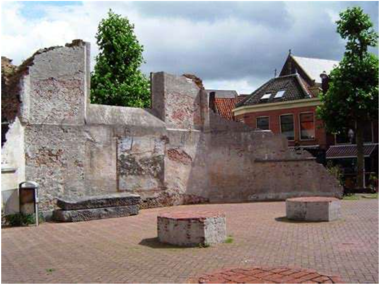
Overblijfselen van de vrouwenkerk in Centrum Leiden die diende als Waalse kerk en waar ook de pilgrim fathers kerkten.