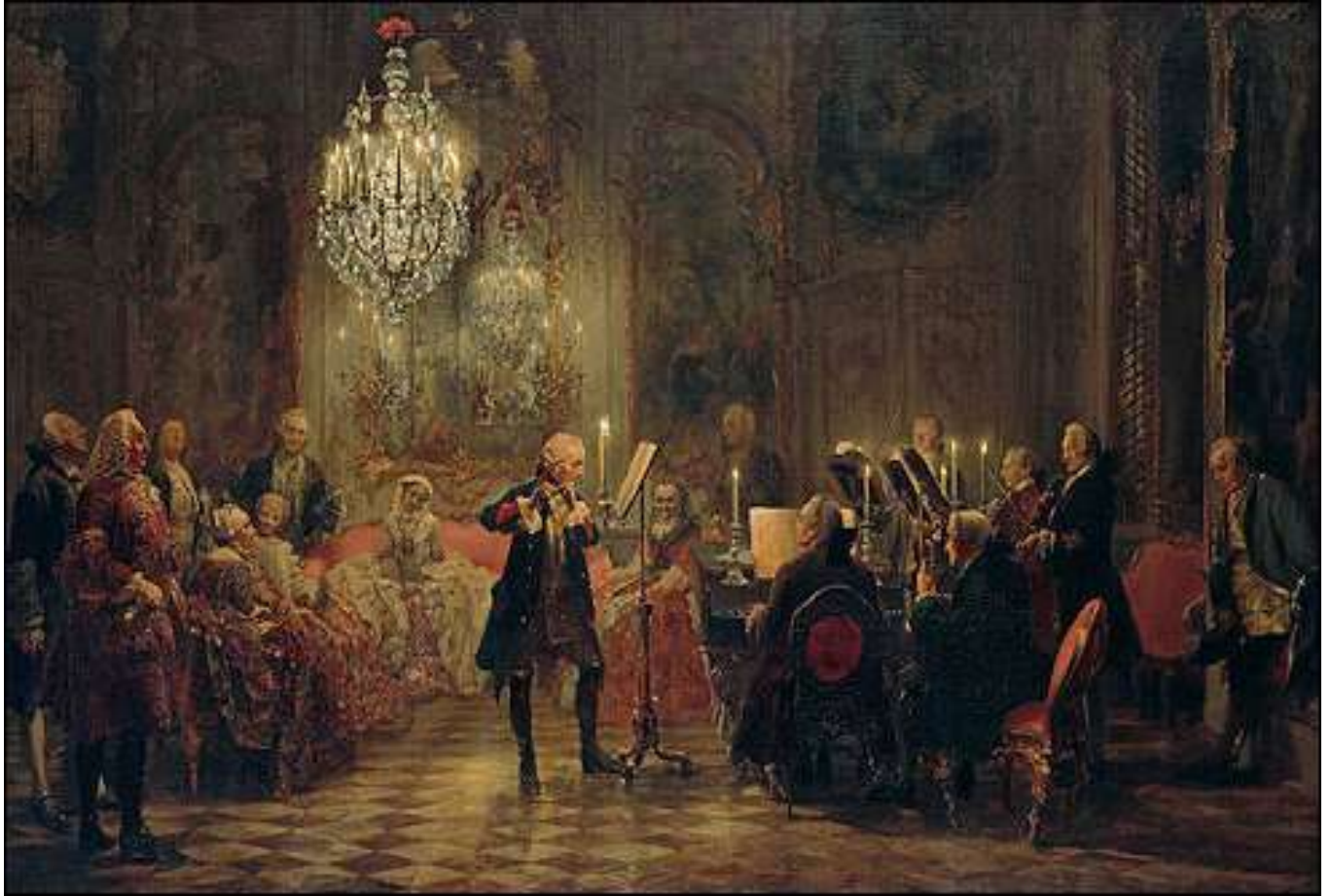
Concert door Frederic de Grote met rechts Joachim Quantz en achter de vleugel C.P.E. Bach