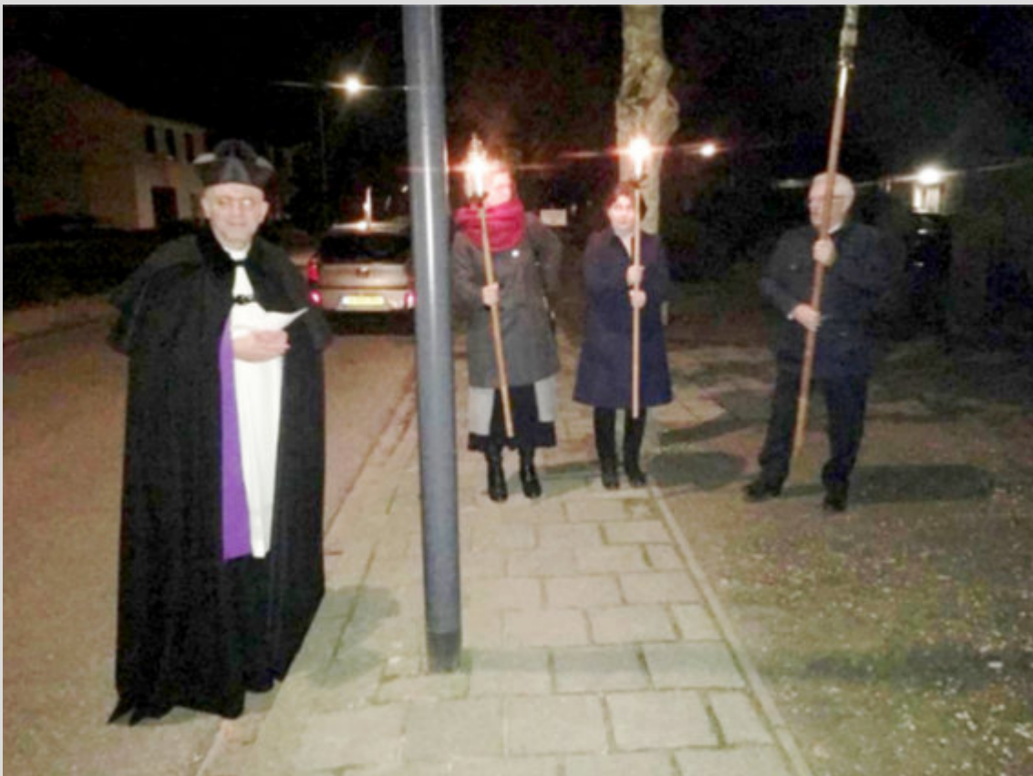
Herdenkingsplechtigheid bij monument dwangarbeiders 1944