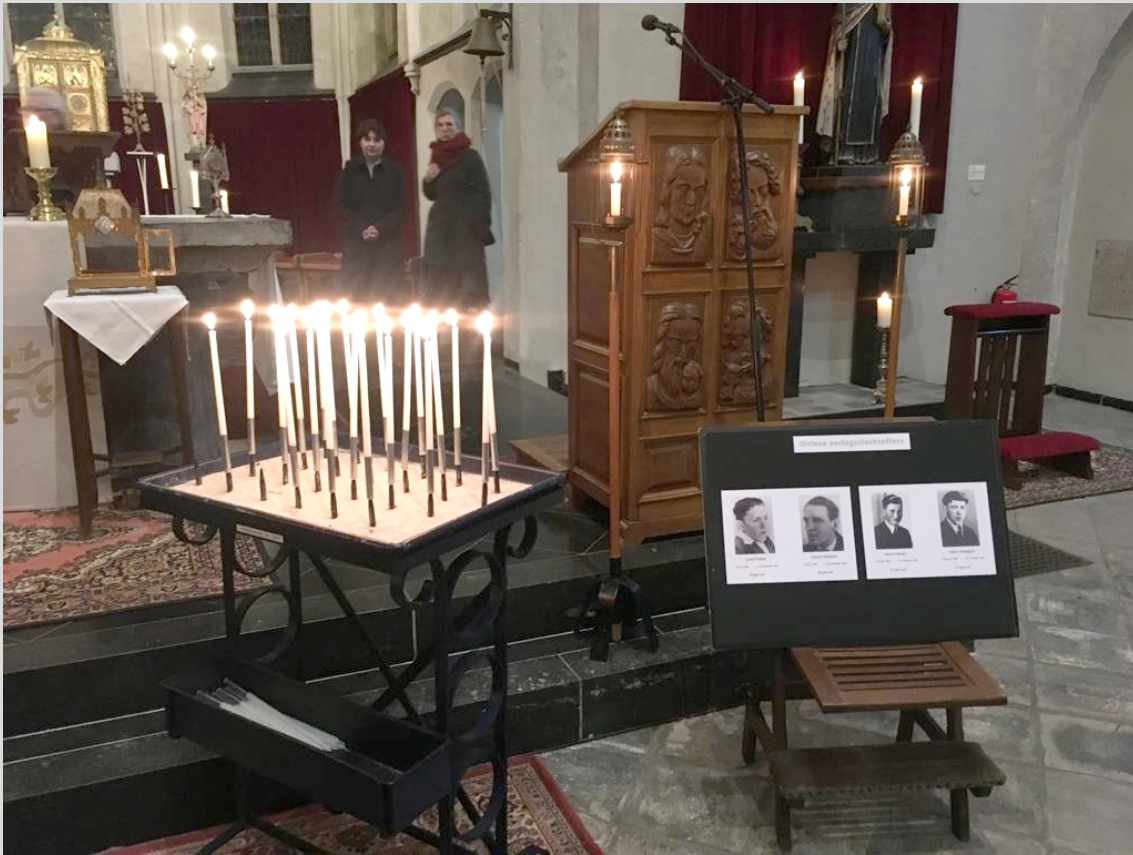
De 4 Oirlose oorlogsslachtoffers 1944