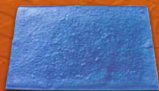
Dalle de Bourgogne

Choix de moules et de colories (pavés, dalles, pierres, bois, ...)