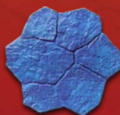
Pierre de Mallorca