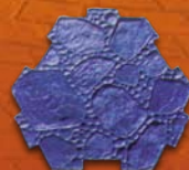
Pierre de Rio