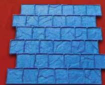
P'tits Pavés français