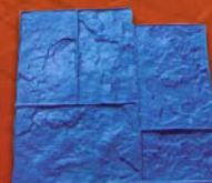
Pierre de Sillery