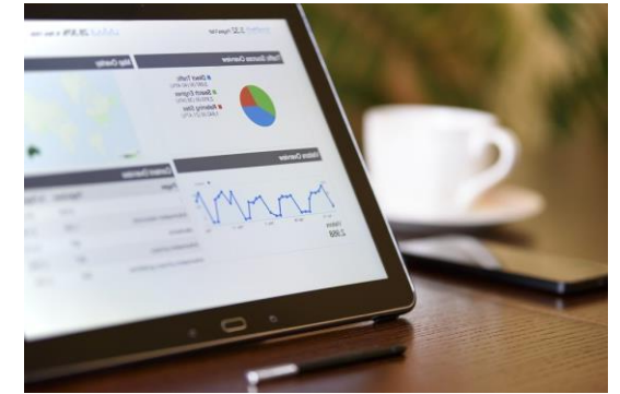
La transformation Digitale Au service de la performance

Sur la base de nos retours d'expériences et des besoins client , nous vous accompagnons dans l'élaboration du besoin, le pilotage du développement avec nos partenaires, la mise en place et le déploiement au travers de formations.