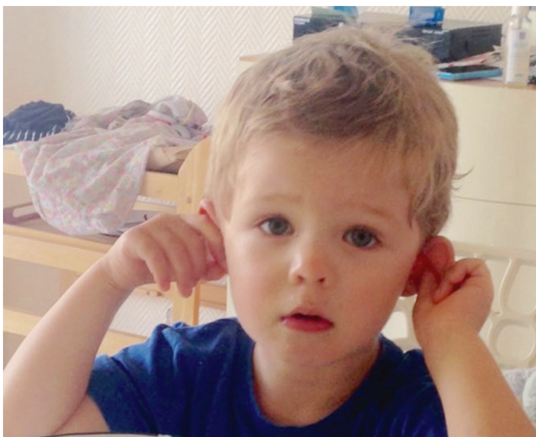
L'enfant qui se frotte les oreilles ou tire dessus avec insistance peut souffrir d'une otite même en l'absence de douleur. Mais il ne faut pas négliger ces signes. ADX

Il faut donc être attentif aux signes chez les bébés qui permettent d'avoir un doute, par exemple s'ils se frottent l'oreille, et seul le médecin