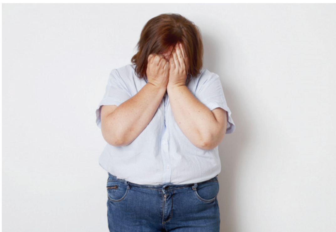
Une des manières d'éviter de prendre du poids est d'apprendre à lire les messages envoyés par l'estomac au cerveau.