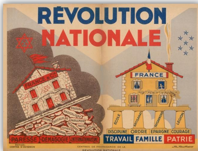
La "Révolution nationale" de l'Etat français du maréchal PETAIN...

Tous les pays européens occupés ou alliés à l'Allemagne, ont ainsi levé des contingents de volontaires pour le front de l'Est, contre le communisme.