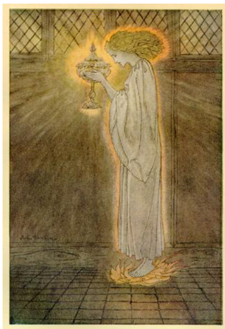
« Porteuse de la Coupe du Saint Graal » d'Arthur Rackham