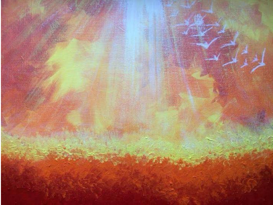
« Divine Love » par Devanshi Sanghvi

Dans cette suite de la Newsletter n°84, le spot est braqué vers le défi et la solution majeurs, induits par la grande Conjonction en Capricorne : Se tourner vers l'Amour pour sauver le Futur.