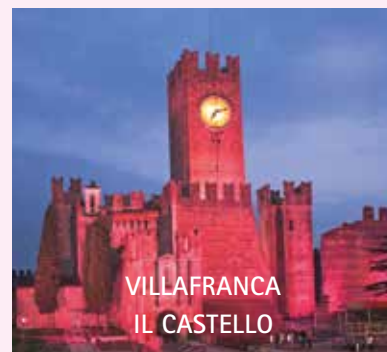
VILLAFRANCA IL CASTELLO

Sono molti i fattori che ci permettono una prevenzione efficace le informazioni mediche, l'attenzione per i corretti stili di vita ed infine i test specifici, per questo motivo la nostra consapevolezza e l'attenzione ai segnali del nostro corpo è così determinante.