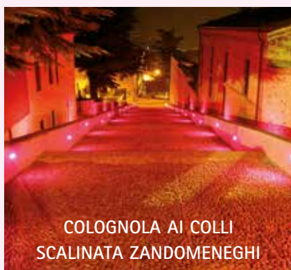
COLOGNOLA AI COLLI SCALINATA ZANDOMENIGHI

Rugola zo da sti scalini una ventada de aria Rosa e noialtre, come butini, la ciapemo ferme in posa. L'è n'arieta calda calda la ne cambia un pò l'umor l'è un tepor che ne riscalda che a la vita dà vigor. Così torna la speranza: l'à cambiàdo de color se un scalin l'è za calcosa par noialtre superar Scalinada tuta Rosa l'è li pronta da scalar.