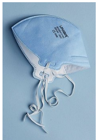
Les masques de protection sont convoités de toutes parts.

C'est la quantité de cocaïne que trois personnes ont tenté de faire rentrer en Suisse lors d'un vol de rapatriement venant du Costa Rica. Un couple transportait 13 kg de cette poudre et une femme 8 kg. Ils ont été surpris avant d'embarquer et ont été placés en détention préventive.