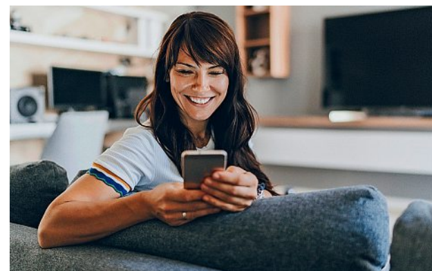
Il faudra patienter avant de rencontrer l'élu de son cœur.