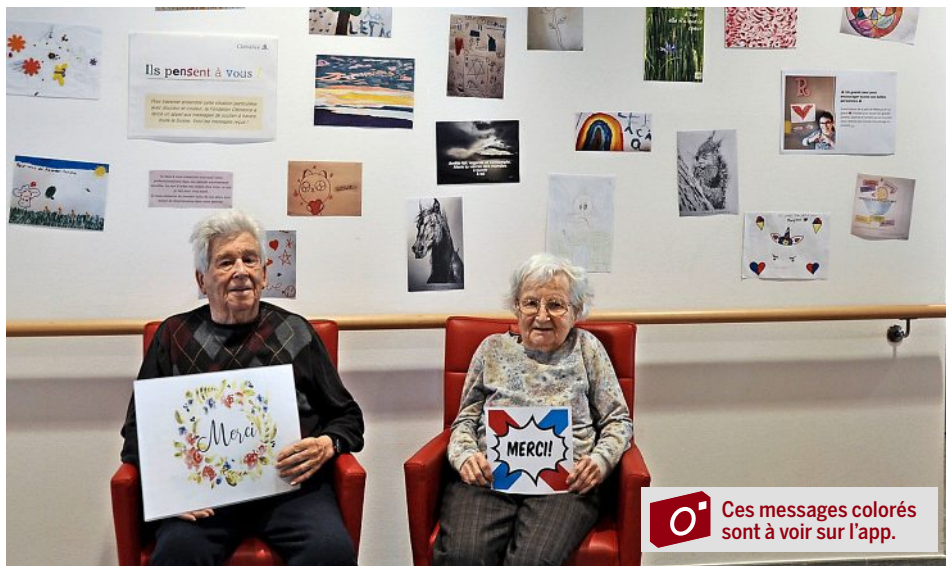
Les soignants souhaitent remercier ceux qui ont envoyé de quoi égayer les journées des résidents.