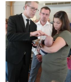
Doop van Revie