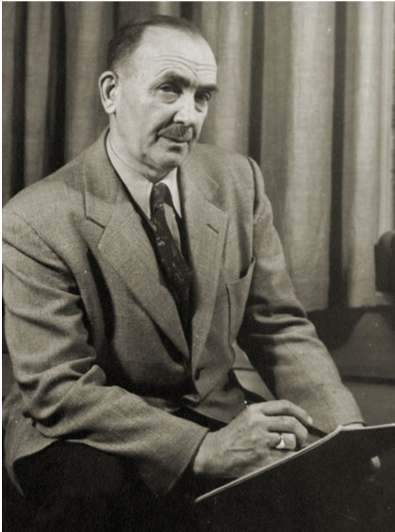
Николас де Грандмезон