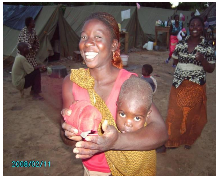
Villaggio di Magoye

I rapporti con Magoye si sono consolidati grazie al turismo responsabile e alla disponibilità delle persone del luogo, in modo da far vivere ai turisti una vacanza alternativa e affascinante.