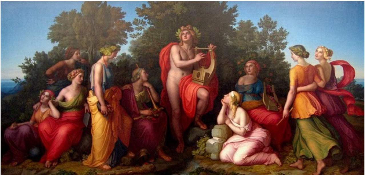
« Apollon et ses Muses » Heinrich Maria von Hess (1826)