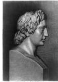
Alexandre Le Grand