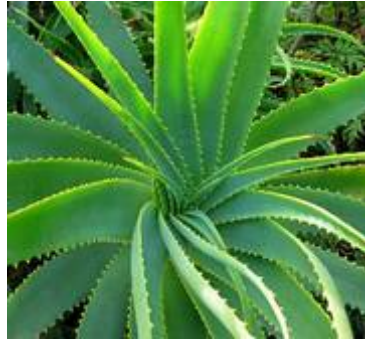
Aloé Vera Barbadosis Miller